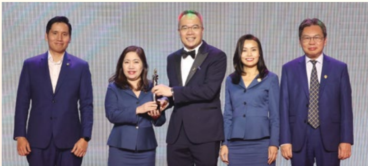
Ban Lãnh đạo HDBank nhận giải HDBank Nơi làm việc tốt nhất Châu Á do HR Asia trao tặng

Văn hóa HDBank được khái quát trong 05 giá trị cốt lõi: khách hàng là trọng tâm; trung thực và trách nhiệm; nhất quán và linh hoạt; chuyên nghiệp và hợp tác; hiệu quả và sáng tạo. Năm 2023, Ban Lãnh đạo HDBank đã thực hiện chuỗi workshop “ Xây dựng văn hóa hướng đến hiệu suất cao ” trên cả nước, từ đó xây dựng bộ tiêu chuẩn