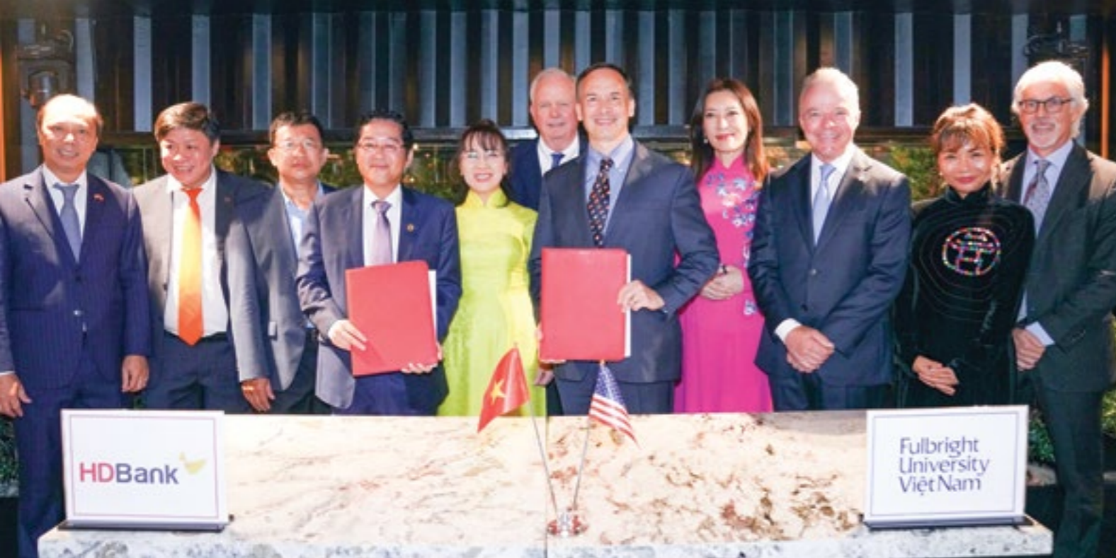
Tháng 9/2023, đúng dịp sự kiện Tổng thống Hoa Kỳ Joe Biden thăm Việt Nam, HDBank và Trường Đại học Fulbright Việt Nam ký kết thỏa thuận hợp tác cung cấp vốn đối ứng trị giá tương đương 20 triệu USD.