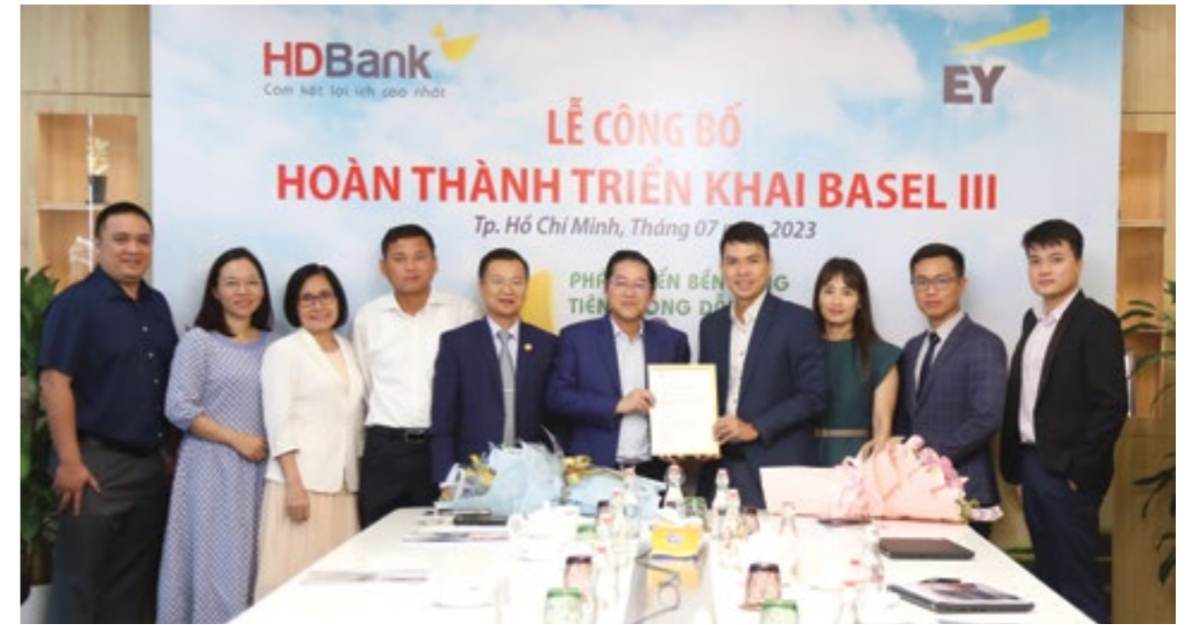
HDBank là một trong những ngân hàng đầu tiên công bố hoàn thành triển khai Basel III