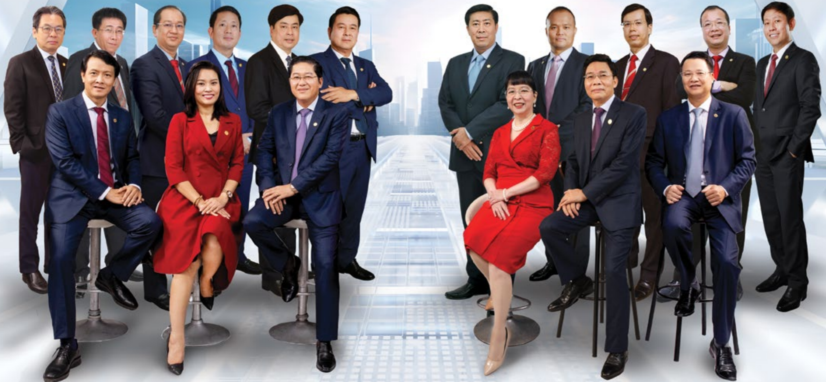
Hàng đứng, từ trái qua phải