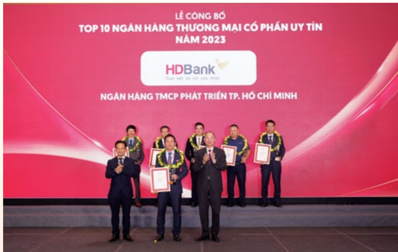
Nhiều năm liền, HDBank duy trì tốc độ tăng trưởng cao trong nhóm đầu ngành, được nhiều tổ chức trong nước và quốc tế ghi nhận bằng những giải thưởng lớn

HDBank không ngừng đa dạng hóa và nâng tầm chất lượng sản phẩm dịch vụ nhằm đáp ứng tốt nhất mọi nhu cầu của khách hàng. Một điểm nhấn nổi bật là việc ra mắt dịch vụ khách hàng ưu tiên HDBank Priority, với hành trình trải nghiệm cao cấp, sản phẩm chuyên biệt, nhiều tiện ích và đặc quyền vượt trội dành cho phân khúc khách hàng cao cấp. Chỉ trong thời gian ngắn sau khi ra mắt, dịch vụ đã được khách hàng đón nhận mạnh mẽ.