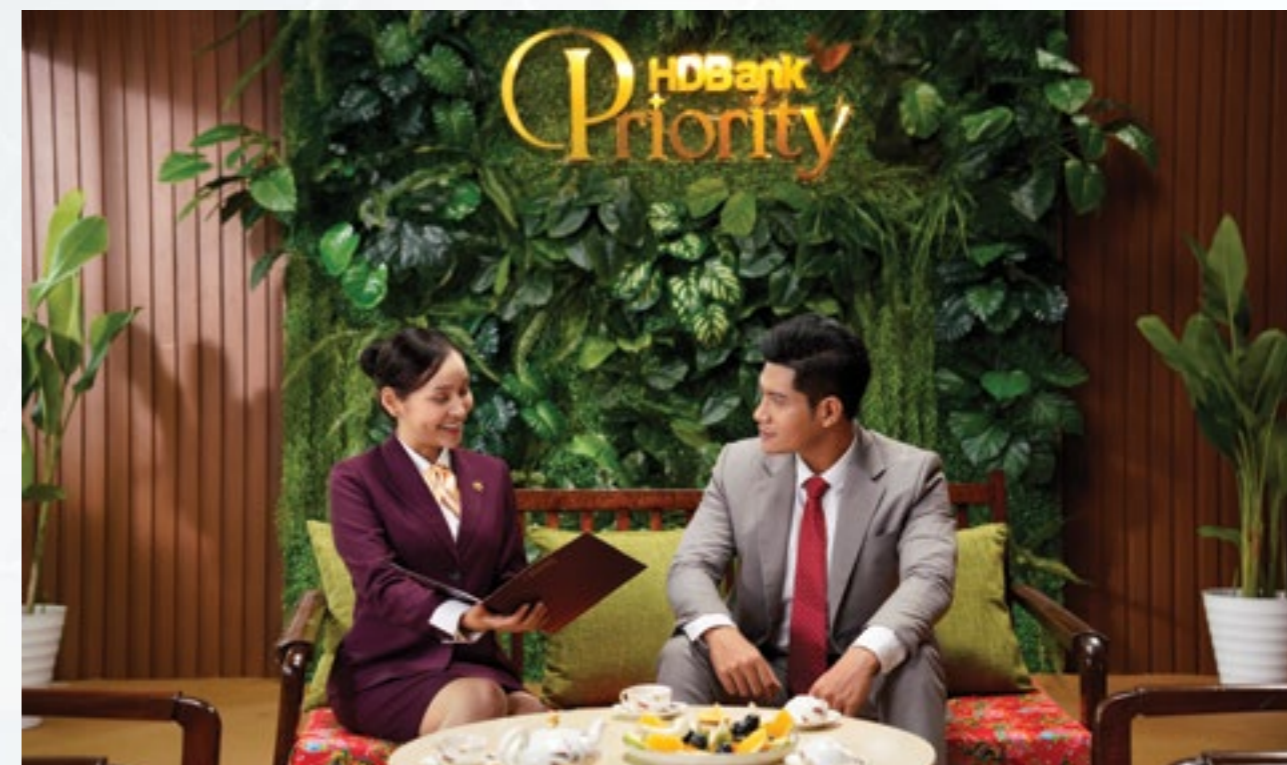
Trong năm 2023, HDBank chính thức ra mắt dịch vụ khách hàng đặc biệt HDBank Priority - “Tận hưởng đặc quyền, gia tăng lợi ích”

Với định hướng kiên toàn, tối ưu hóa mạng lưới hoạt động, HDBank liên tục cải tiến, nâng tầm quy mô và hiệu quả hoạt động của các Chi nhánh, Phòng giao dịch nhằm đảm bảo hoạt động an toàn, hiệu quả và bền vững. Ngoài ra, mô hình giao dịch ngân hàng tự động Kiosk Bank từng bước đưa vào hoạt động, khai trương các Trung tâm Khách hàng Doanh nghiệp trên khắp cả nước để mở rộng địa bàn hoạt động.