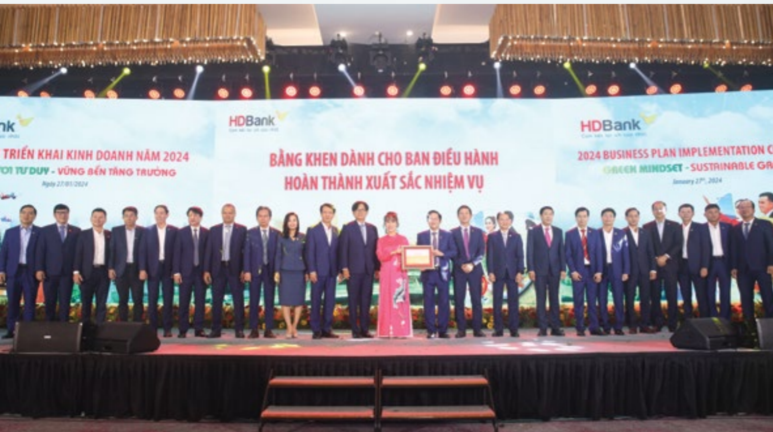
Hội đồng Quản trị trao Bằng khen cho Ban Điều hành tại Hội nghị Triển khai kinh doanh năm 2024

Năm 2023 diễn ra với nhiều khó khăn, thách thức trong bối cảnh kinh tế thế giới tăng trưởng chậm, lạm phát cao, thương mại toàn cầu sụt giảm, giá cả hàng hóa cơ bản biến động mạnh, xung đột địa chính trị, ngân hàng trung ương nhiều nước tiếp tục neo giữ lãi suất điều hành ở mức cao, Cục Dự trữ liên bang Mỹ (FED) 4 lần tăng lãi suất, ngân hàng Trung ương Châu Âu (ECB) 5 lần tăng lãi suất, đồng tiền nhiều nước mất giá mạnh. Trong nước, các động lực tăng trưởng xuất khẩu, đầu tư, tiêu dùng đều gặp thách thức vì cầu thế giới thấp, doanh nghiệp gặp nhiều khó khăn do đơn hàng, thị trường sụt giảm, các vụ việc liên quan đến trái phiếu doanh nghiệp, bảo hiểm tiếp tục tác động đến tâm lý thị trường và ổn định hệ thống ngân hàng.